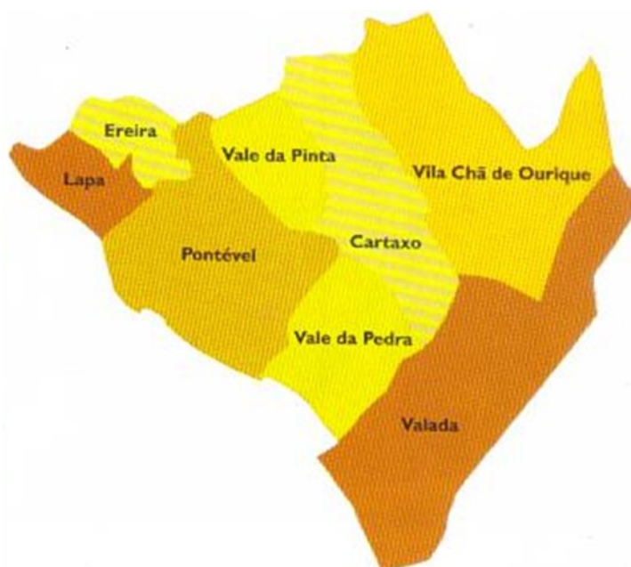
Imagem 1 – Concelho do Cartaxo

Decimais (GPS) - 39.1599501, -8.7881691 KML | GPX